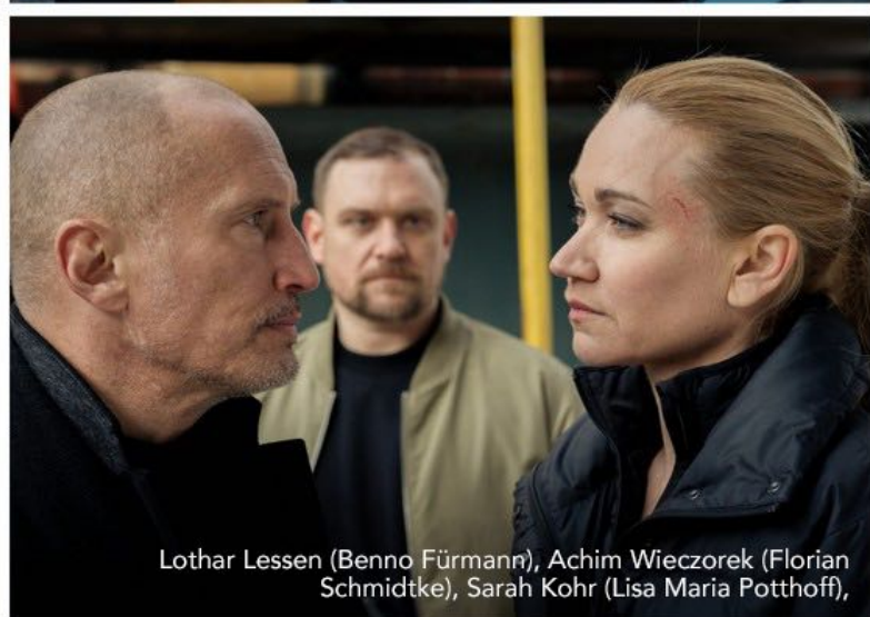
Lothar Lessen (Benno Fürmann), Achim Wieczorek (Florian Schmidtke), Sarah Kohr (Lisa Maria Potthoff)