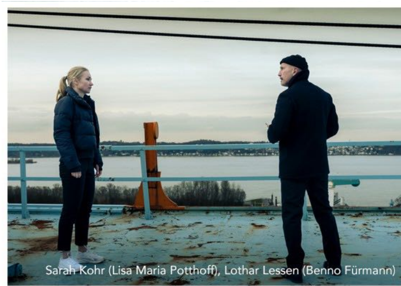
Sarah Kohr (Lisa Maria Potthoff), Lothar Lessen (Benno Fürmann)