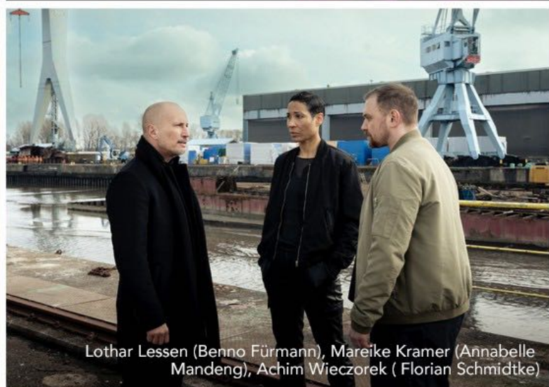
Lothar Lessen (Benno Fürmann), Mareike Kramer (Annabelle Mandeng), Achim Wieczorek (Florian Schmidtke)